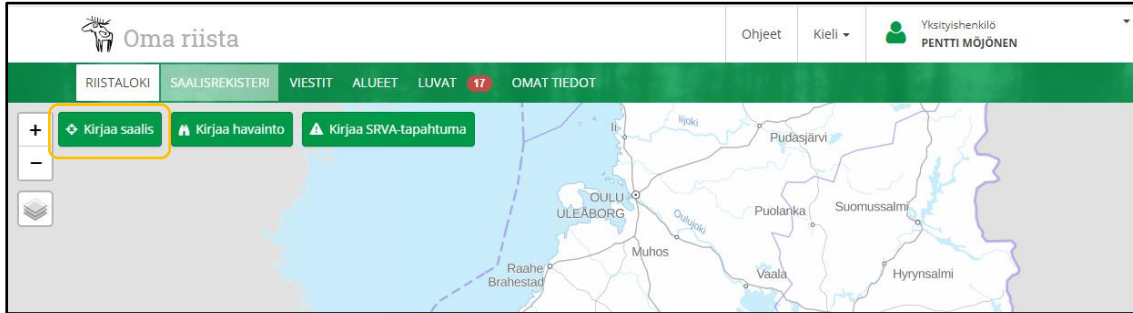
Kuva 1. Riistaloki-valikko